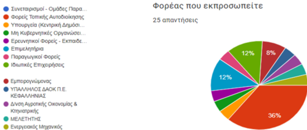
Διάγραμμα 1. Είδος συμμετεχόντων στη διαδικασία ιεράρχησης των αναγκών.

Στη συμπλήρωση των ερωτηματολογίων συμμετείχαν 25 φορείς, εκπρόσωποι του τοπικού κοινωνικοοικονομικού συστήματος διακυβέρνησης και οι οποίοι αξιολόγησαν τις 41 καθορισμένες ανάγκες (Παράρτημα, I Συμμετέχοντες στη διαδικασία Ιεράρχησης των αναγκών).